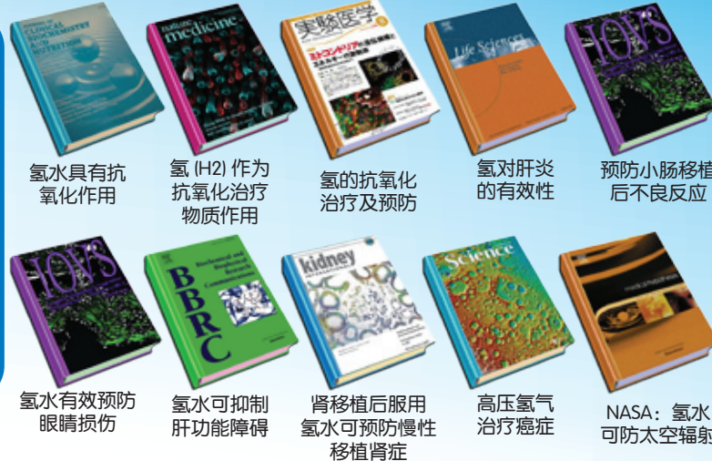
氢水具有抗氧化作用

氢是促进健康与美丽的关键因素, 只需6个月, 就能见证H4O活氢水素水带给您的神奇效果!